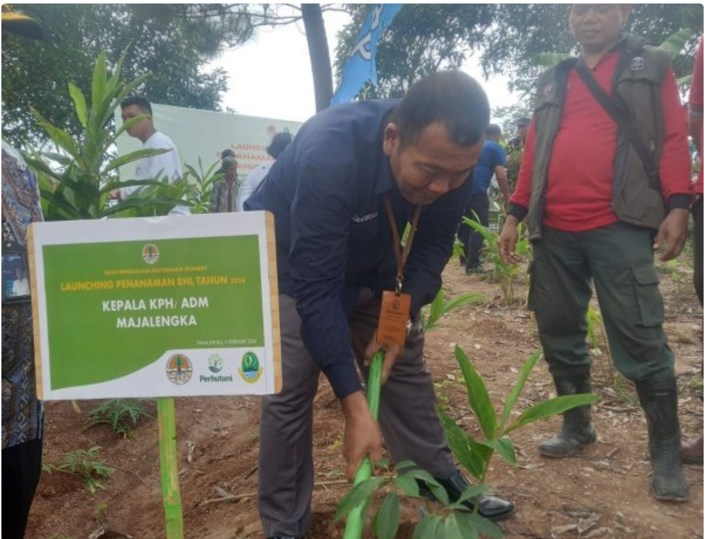
Administratur melakukan penanaman pohon